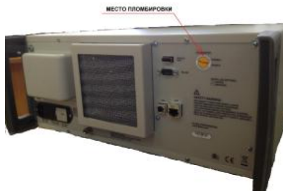
Рисунок 2 – Схема пломбировки от несанкционированного доступа.